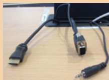
HDMI VGA + jack

En mode visio , les vidéo-projecteurs s'allument automatiquement. Il faut ensuite connecter l'ordinateur au câble HDMI (ou au VGA + jack) de la chaire et appuyer sur Partager le contenu sur la dalle tactile pour le diffuser à l'écran et aux sites distants.