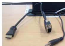
HDMI VGA + jack

En mode local , pour allumer les vidéo-projecteurs, il est nécessaire de déverrouiller la dalle. Il faut ensuite connecter l'ordinateur au câble HDMI (ou au VGA + jack) de la chaire. La diffusion sur les écrans est automatique. En utilisant le mode avancé, il est possible de diffuser une seconde source sur l'un des deux écrans. Celle-ci doit être branchée sur l'une des entrées de la platine.